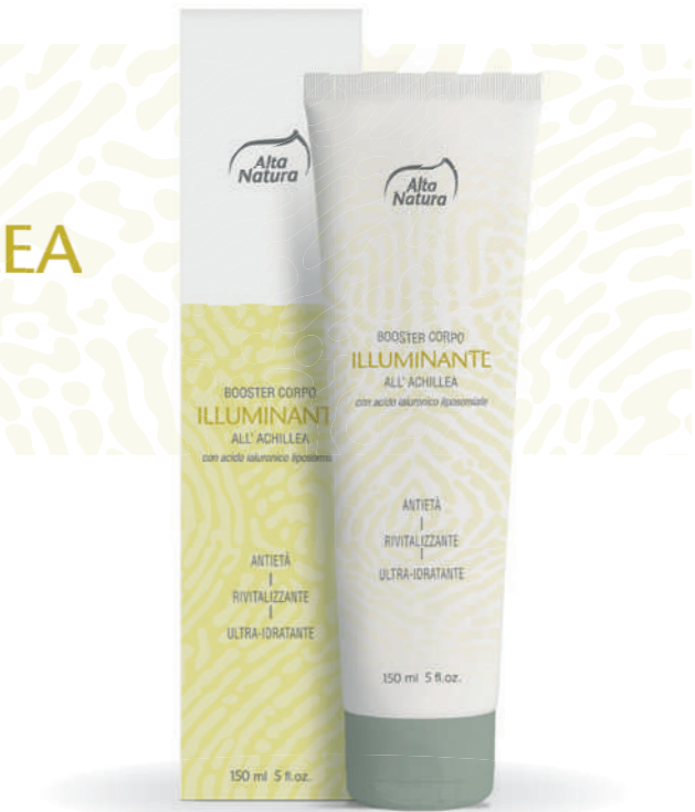
BOOSTER CORPO ILLUMINANTE ALL' ACHILLEA con acido ialuronico liposomiale

NICKEL TESTED *Nickel (<math><0,00001</math>)