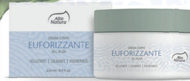
CREMA CORPO EUFORIZZANTE ALL' ALGA