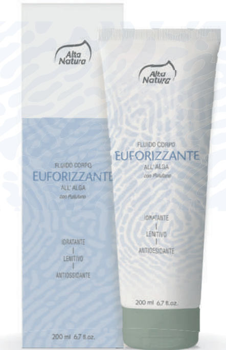
FLUIDO CORPO EUFORIZZANTE ALL' ALGA con Pullulano

NICKEL TESTED *Nickel (<math><0,00001</math>)