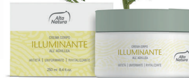
CREMA CORPO ILLUMINANTE ALL' ACHILLEA